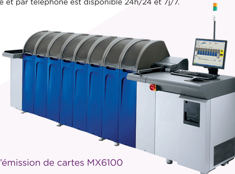
Systèmes d'émission de cartes MX6100

Service et assistance : les systèmes de la série MX sont appuyés par le plus grand réseau de service et d'assistance du secteur, qui s'étend sur plus de 150 pays dans le monde. L'assistance en ligne et par téléphone est disponible 24h/24 et 7j/7.