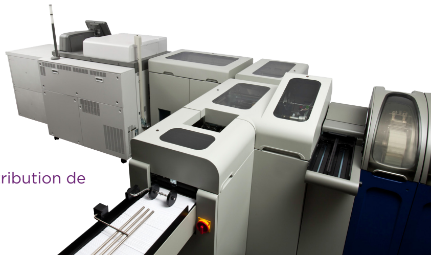
Système de distribution de cartes MXD610

Soutenir les tendances du marché : répondre à la tendance verticale croissante des cartes sans limiter la taille des tâches en fonction de l'orientation des cartes. Placez dynamiquement les cartes sur les supports horizontalement et verticalement pour répondre aux demandes des clients.